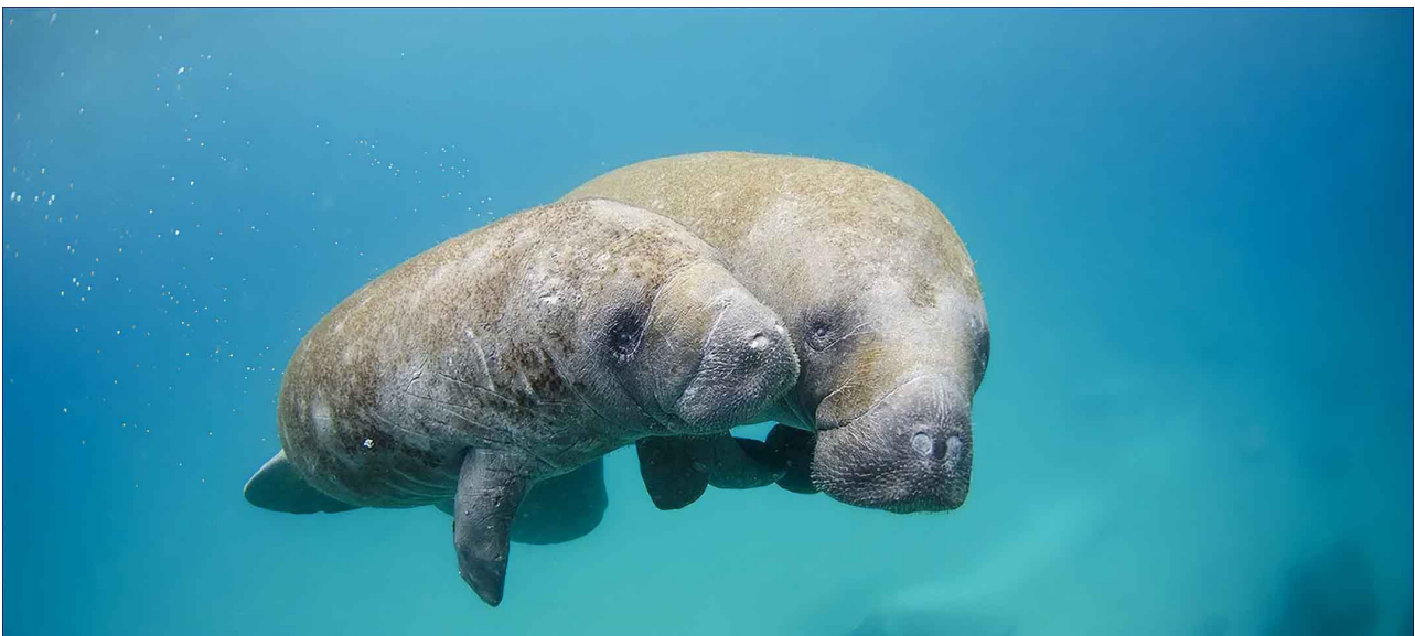
Deux lamantins à l'ouest de Palm Beach, en Floride – Photo : Sam Farkas, National Geographic